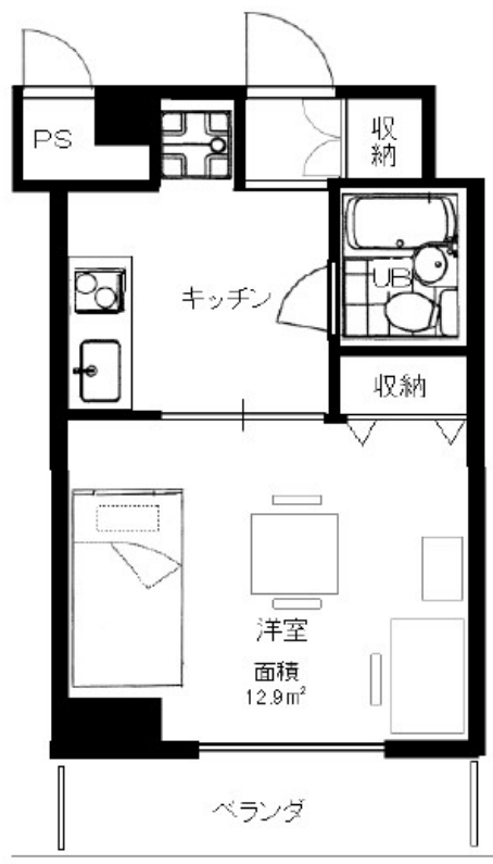
Room size: 25.44㎡ One room type

国際交流会館“I-wingなかもず”は、中百舌鳥キャンパス内に位置する、宿舎エリア、交流エリア、サポートエリアの3つの機能を持つ国際交流施設です。留学生と日本人学生、海外からの研究者が生活を共にし、異文化との出会いと体験を通して、お互いの文化に対する理解を深めます。著名な研究者も滞在し共同生活することで、教育・研究のフィールドにおける、グローバルな人的ネットワークの形成を促します。