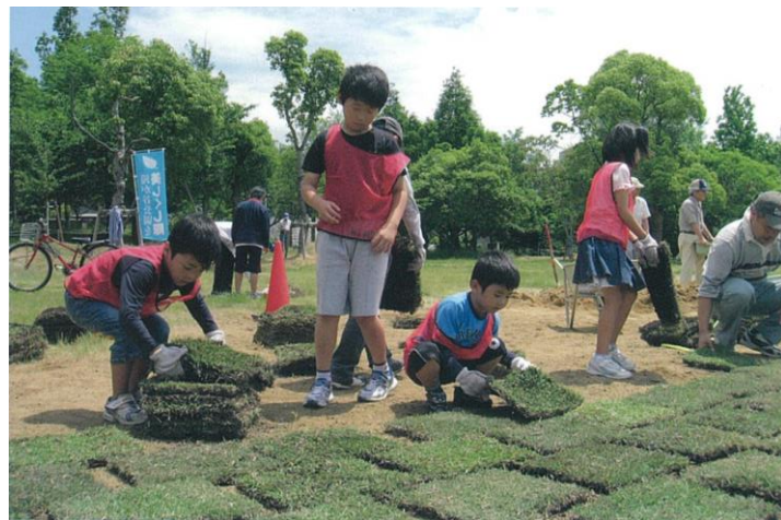
滝が谷公園の芝生施工の様子