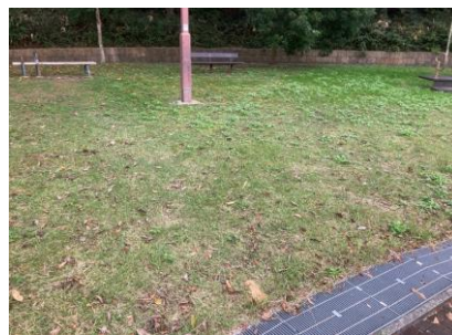
井吹台西公園の芝生広場