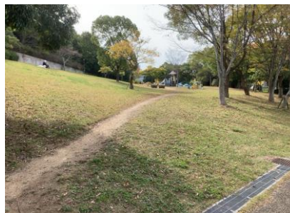
井吹台東公園の芝生広場