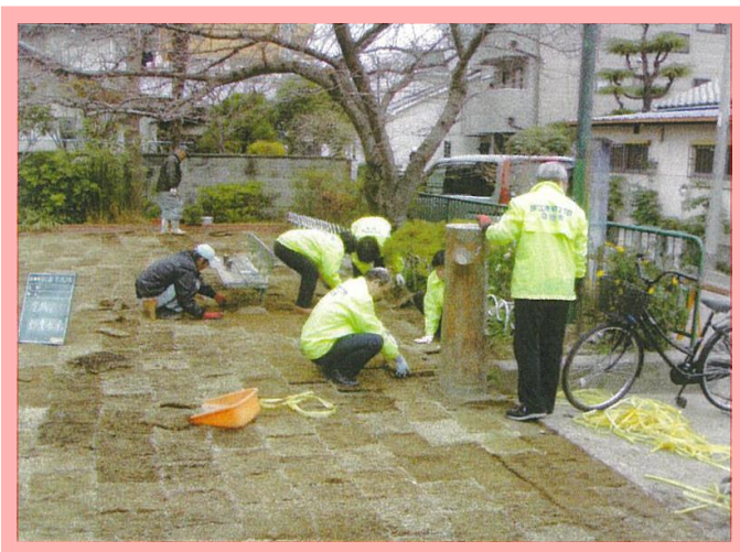
東公園の芝生施工の様子