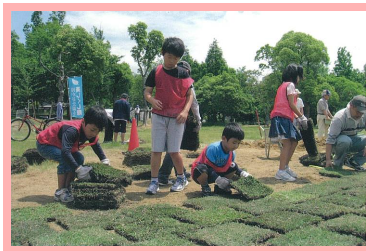
滝が谷公園の芝生施工の様子