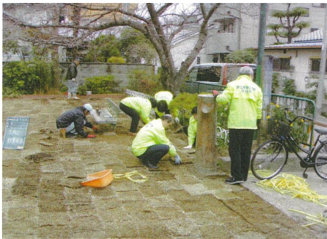
東公園の芝生施工の様子