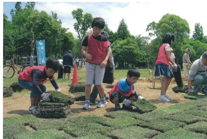
滝が谷公園の芝生施工の様子