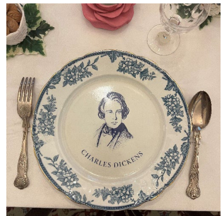
(自分の専攻に関する博物館に行きました)