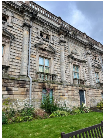
(ノッティンガム城)

トに行きました。他の日には、トラムに乗って お買い物を楽しむことや、特急のチケットを 買ってロンドンを観光することをしました。 ロンドン観光は、列車のストライキがあり、事 前に予約していた列車がキャンセルになるこ ともあり、予定が変更になってしまいましたが、 充実した旅行をすることができました。なん でも自分だけで解決しようとせずに駅員さ んに尋ねてから疑問を解決して行動するこ とが大切だと思いました。トラブルがあると自分 が伝えたいことを英語で伝えることがより難 しくなってしまいますが、駅員さんも優しく丁 寧に対応してくださいました。