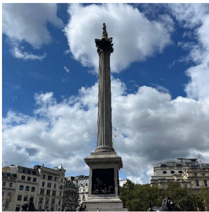
(One Direction が好きなので、MV のロケ地に行きました)