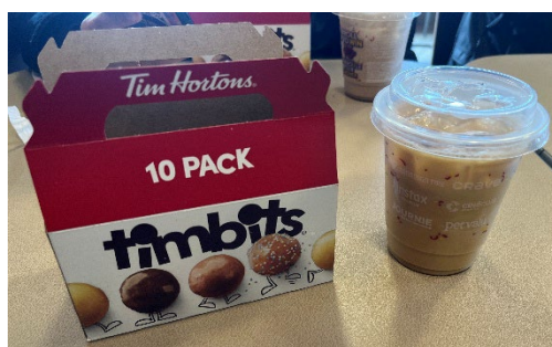
↑写真③ timhortons の timbits