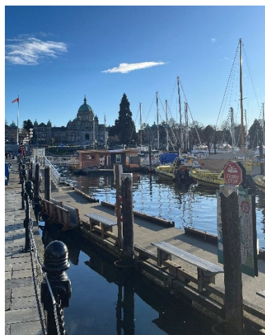
↑写真① インナーハーバー

英語を喋ることが当たり前な環境で1か月生活したことによって、英語を喋ることに対する抵抗感がなくなりました。この1か月で自分の英語が飛躍的に成長したということはありませんでしたが、今後の英語学習の方向性を決めるよいきっかけになったと思います。帰国後も英語の勉強を続け、英語に触れ続けていたいと思っています。また、留学前から長期留学への意欲がありましたがこの留学を経て、さらにその思いが強くなりました。もちろん英語だけではなく、カナダでの生活によって日本とカナダの文化や価値観の様々な違いにも気づきました。この気づきはどちらの文化、価値観が優れているかということではなく、新たな文化、価値観を知り自分の世界を広げることになりました。人によって異なると思いますが、自分にとっては今まで知らなかった新たな文化、価値観に触れることはとても楽しいです。この留学は新しい発見の連続で、とても刺激的で楽しかったです。みなさんもぜひ、新しい価値観や文化に触れて自分の世界を広げていってください！