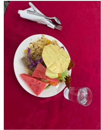
Figure 4 学食

放課後は、近くのモールへ食事に行ったり、タクシーで飲食店へ移動したりすることが多かったです。時にはボウリングやカラオケに行くこともありましたが、基本的には食事をしてホテルに戻ることが多かったです。待ち合わせは夜 7 時半頃にホテルのロビーで行われることが多かったため、それまでの時間に洗濯をしたり、簡単な課題をしたりして過ごしました。もし外出が難しい場合には、配達サービスを利用してホテルで食事をとることもできました。土曜日のトリップではクアラルンプール周辺の観光地を訪れ、写真を撮ったり、文化体験をしたりしました。バスで 2 時間ほどかけてマレーシア発祥の地を訪れたり、郊外で凧揚げなどの伝統的な文化体験を行ったりしました。