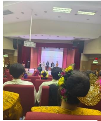
Figure 2 終業式

休日については、土曜日には1日かけたトリップが企画されており、大学から離れた観光地を訪れて歴史や文化を体験しました。日曜日は完全に自由時間で、日本人学生やバディと計画を立てて出かけたり、ホテルで休んだりして過ごしました。