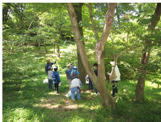
昨年のサマースクールの様子