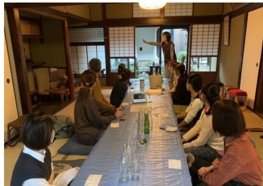
オープンナガヤ大阪 2022 の長屋ツアーの様子