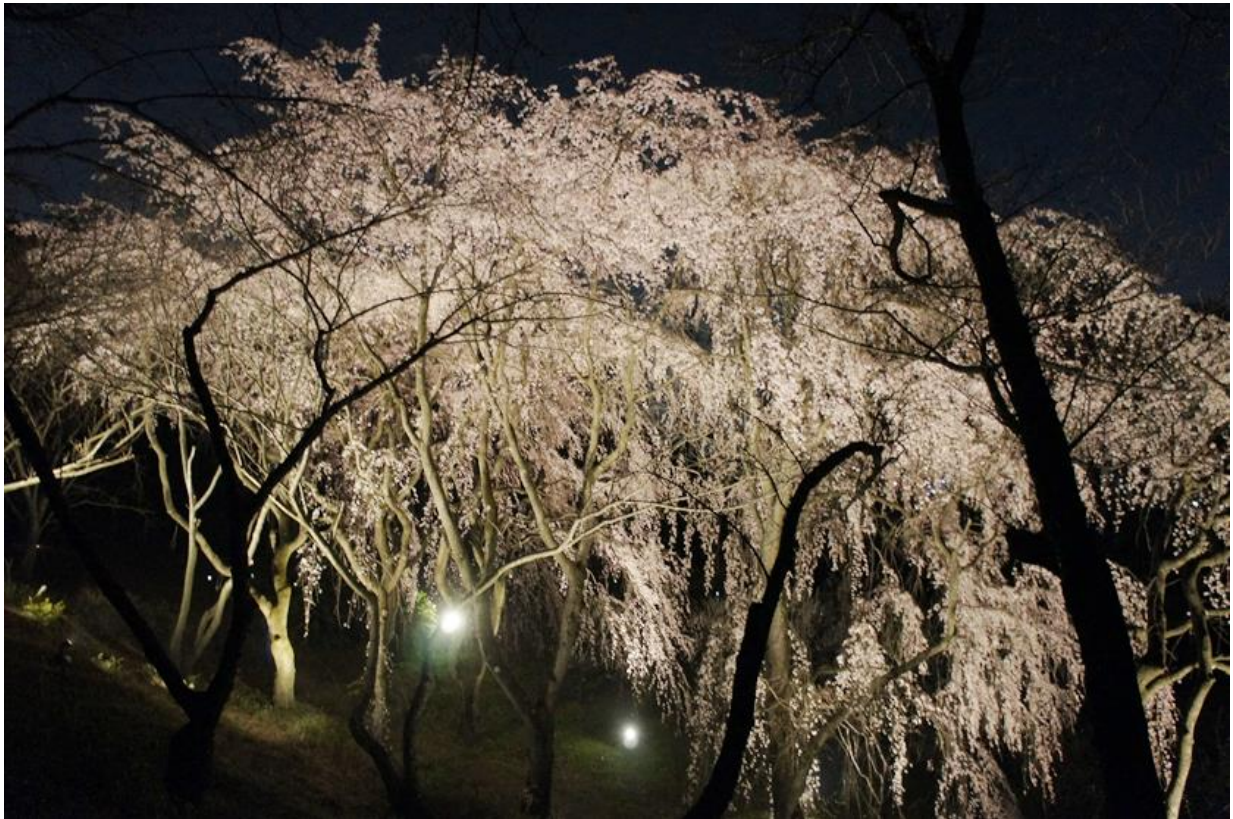
[ライトアップされた園内のイトザクラ]

また、本園にはこれら枝垂れ桜のほか、58種の園芸品種や野生種を約190本植栽しており、それぞれ開花時期が異なり、例年3月下旬～5月上旬までお楽しみいただけます。