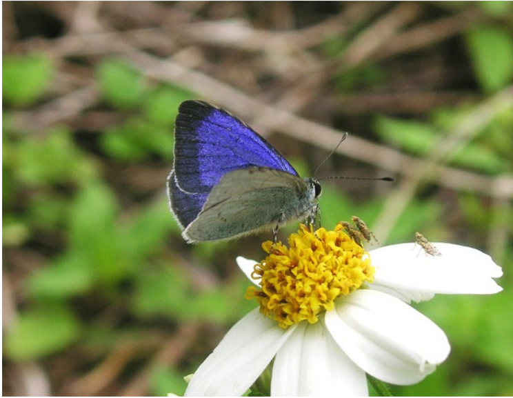
(図1) オガサワラシジミの成虫写真