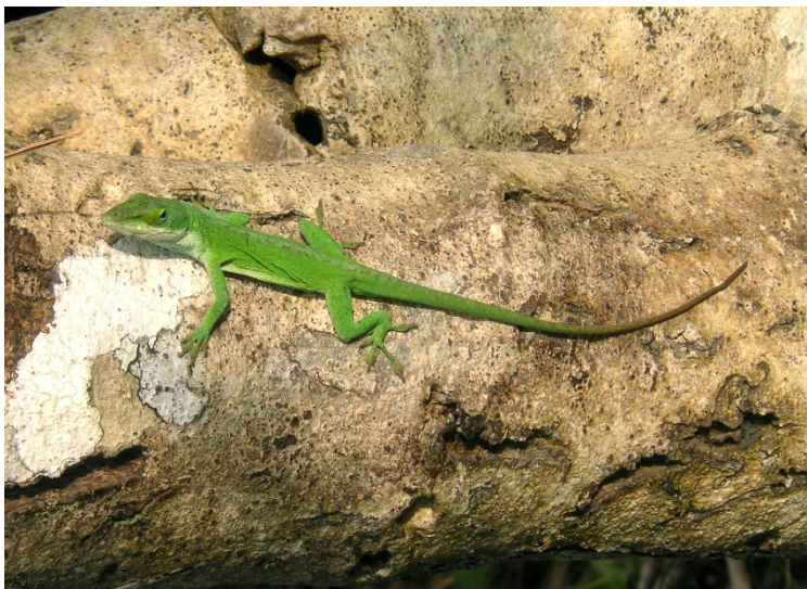
(図2) グリーンアノールの写真。本種をはじめとした侵略的外来種による捕食により、オガサワラシジミは個体数を減少させたと考えられている。