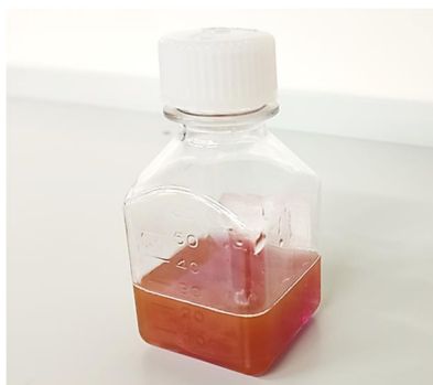
図1. 金ナノ粒子のコロイド水溶液

プラズモン加熱の研究において、ひとつの常識となっていたのが、「光で加熱されているナノ粒子の表面は、完全に等温になる」というものでした。そもそも金は、多くの金属の中でも特に熱の伝導性が良いので、非常に小さなナノ粒子の表面では「温度差が生じるはずがない」とされてきました。