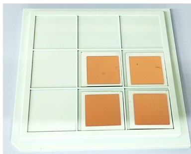
図2. 著者らが作製した窒化チタンの薄膜

本研究グループでは、「ナノ粒子の表面の狙った箇所だけを、光によって選択的に加熱する」ことができれば、新たなブレイクスルーになると考えてきました。