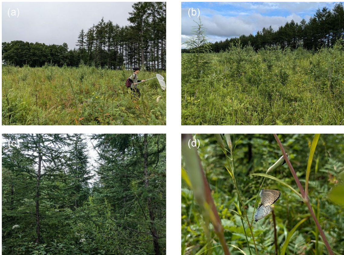
図2 調査地の風景。a, 2年目の植林地; b, 5年目の植林地; c, 9年目の植林地; d, 6年目の植林地で交尾する準絶滅危惧種ゴマシジミのペア。なお、aに写った男性は第三著者。