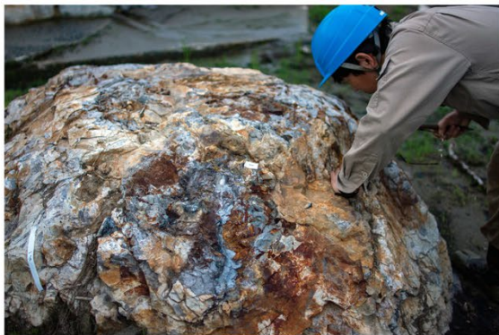
図4. ワタリアの大型の化石樹幹