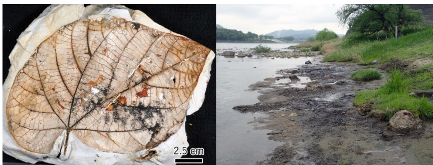
図. オベチェの仲間だけからなる化石林(右)とその林床を覆うウリノキモドキ(左)。

なお、本研究成果は、2023 年 6 月 22 日（木）公開の Scientific Reports 誌に掲載されました。