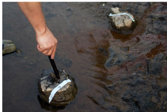
図5. ワタリアの若い化石樹幹