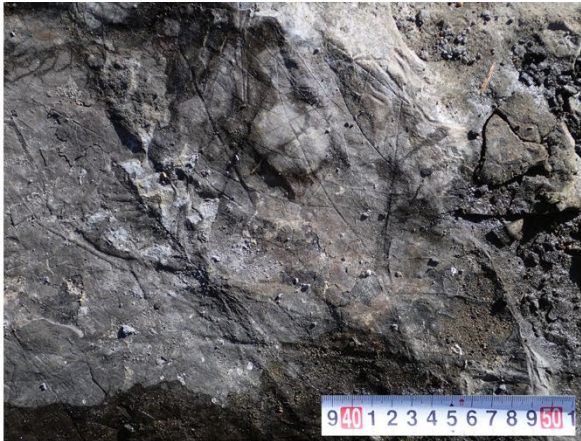
図1. ウリノキモドキの落葉層