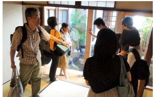
高岡先生が建物の内部を説明されている様子