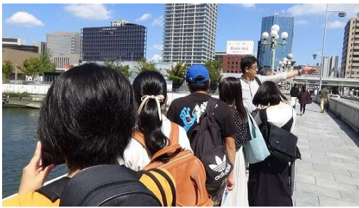
嘉名先生が街と建物の関係を説明される様子