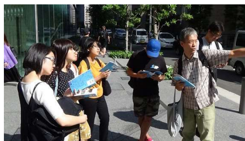
高岡先生の説明の様子