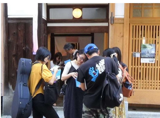
みんなで確認合っている様子