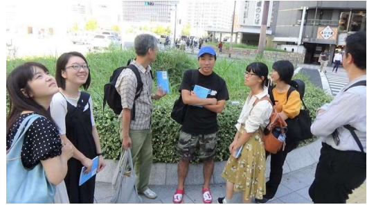
嘉名先生、高岡先生の説明の様子