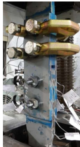
Fig.3 Slip tests