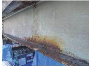
(a) Corrosion of the bridge girder

剤は不陸修正を目的に、腐食により減肉した箇所へ充填されます。また、接着剤を塗布することにより、 見かけすべり耐力 が増加すると考えられるため、ボルト本数が削減されることが期待されています。本研究では、動力工具による 既設部剤 （母板）の接合面の粗さの違いが、併用接合のすべり耐力や接合面の破壊モードに及ぼす影響を検討します。