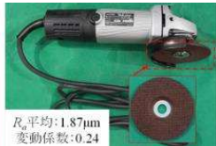
(b) Disc grinding tool