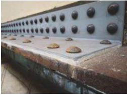
(c) High-strength bolted joints with adhesive