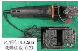
(a) Blaster tool