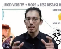
2020年大会 最優秀賞受賞者

博士課程学生が、3分間の限られた時間内に、たった1枚のスライドのみを使って自身の研究のビジョンと魅力を分かりやすく語ります。全国から動画審査を勝ち抜いたファイナリストたちの発表に心を動かされたら、是非一票を投じてください。事前登録していただければ、Zoom視聴中に投票していただくことができます。発表者情報、事前登録・視聴情報は大会公式サイトをご参照ください。