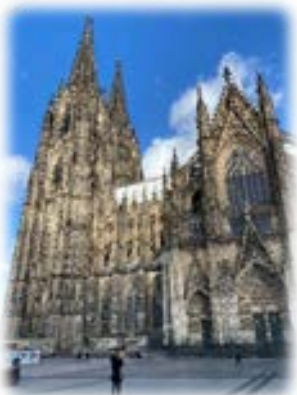
ケルン大聖堂 (Kölner Dom)

頑張って勉強したドイツ語の能力を客観的に証明する資格として、「英検」と同じように「独検」(ドイツ語技能検定試験)があります。毎年 2 回、夏と冬に検定試験が行われて、学生を中心に子どもから大人まで、たくさんの方が資格を手しています。1 級から 5 級まで、レベルに応じて受験することができます(夏は 2・3・4・5 級のみ、冬はすべてのランクの認定試験が行われます)。将来に役立てようという人も、ひとつか試しをという人も、チャレンジしてみてもどうでしょうか。