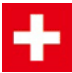
スイス連邦 Schweizerische Eidgenossenschaft

ドイツ語は、ドイツはもとより、オーストリア(オース「ラ」リアと間違えないでね。音楽の街ウィーンを首都とする、ドイツの南東に位置する国です)やスイスの大部分でも使われている言語です。音楽やアルペンスキーをはじめとするウィンタースポーツの盛んな美しい山国オーストリアや、アルプスと湖の国スイスも、ドイツ語の世界なのです。下のヨーロッパ地図を見てください。マークされた所がドイツ語の使われている地域「ドイツ語圏」です。