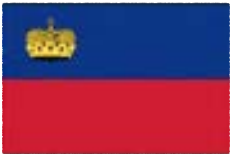
リヒテンシュタイン公国 Fürstentum Liechtenstein