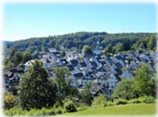
フロイデンベルク (Freudenberg) の街並み

また、私たちの身近な食べ物についても、ドイツ語由来のものが数多くあります。例えばバウムクーヘンはドイツ語では Baumkuchen と書き、Baum は「木」、Kuchen は「ケーキ」という意味です。他にもウィナーソーセージは「ウィーンの」という意味の Wiener から来ていますし、クリスマスに見かけるシュトレン(Stollen)もドイツ発祥です。また、関西発の洋菓子メーカーであるユーハイムは、ドイツ人菓子職人カール・ユーハイム(Karl Juchheim)の名に由来しています。