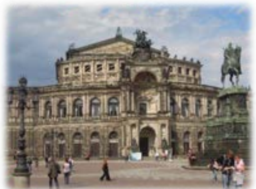
ドレスデン (Dresden) のゼンパー歌劇場 (Semperoper)

ドイツ語は独特の硬さと音の強さを持つため、ベートーヴェン『交響曲第九番』の力強い合唱や、ヴァーグナー『ニーベルングの指環』の壮大な世界観にぴったりと合っていますが、ファンタジー的な世界観のアニメやゲーム・漫画等でもドイツ語の単語がしばしば用いられています。一年間の学習を通じて、これまでに勉強してきた英語とはまた違った音の響きの世界を楽しんでもらえたらと思います。