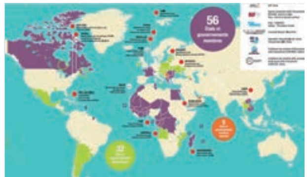
国際フランコフォニー機構加盟国地域