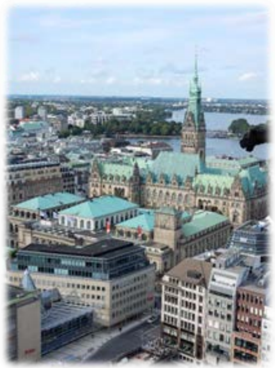
ハンブルク市庁舎 (Hamburger Rathaus)

次に来る単語と音を連結させるリエゾンやリンクング(far away [fɑəə'weɪ] や need you [ni:dju] のような読み方)もありますが、英語よりも簡単に発音に馴染むことができますと思います。