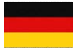
ドイツ連邦共和国 Bundesrepublik Deutschland