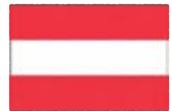
オーストリア共和国 Republik Österreich

ドイツ語圏に限らず、ドイツ語はヨーロッパを中心に様々な地域で使われています。世界ではおよそ1億3千万人以上の人々がドイツ語を話しているのです。