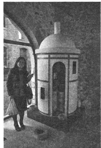
リモージュ焼の最古の窯元にて (2014年12月撮影)