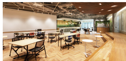
MUIC Kansai 内 コワーキングスペース