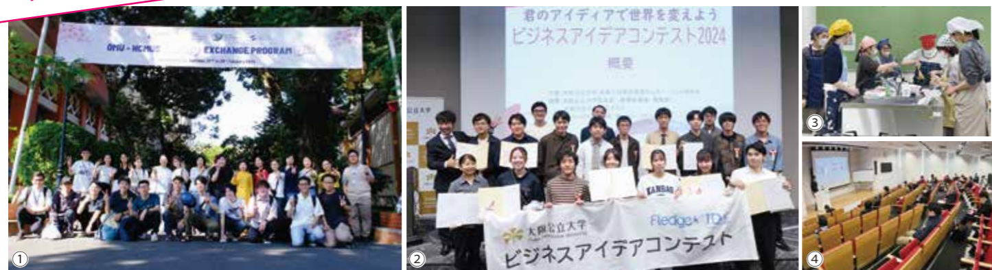
① パンヤピワット経営大学研修2024(タイ) ② ビジネスアイデアコンテスト2024 ③ OMUライスプロジェクト ④ ビジネス企画発表会

学域生、学部生から大学院生まで気軽にご参加いただけるイベントが多数あります。ホームページ・学内看板などで募集いたしますので、ご興味のある方は、Fledge 事務局までご連絡ください。