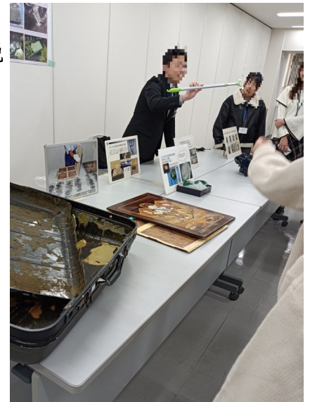
実際に持ち込まれた隠匿具の説明

さらに、麻薬探知犬が登場し、旅客検査の様子をデモンストレーションしてくれました。その探知の速さと正確さに、参加者は皆驚いていました。