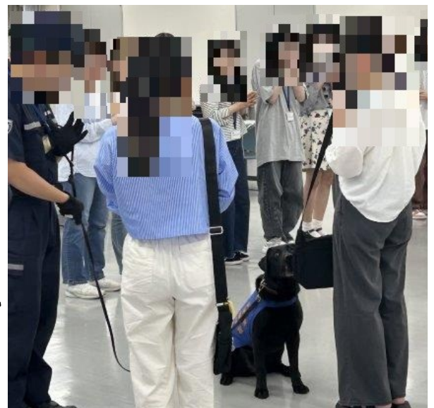
麻薬探知犬デモ 靴についた僅かな麻薬のにおいにも反応し座りました！

さらに、違法薬物を隠していた物品や、偽ブランド品の展示説明を受けました。実際にブランド品の本物と偽物を触って、どちらが本物か当てるクイズを出していただいたりして、大いに盛り上がりました。