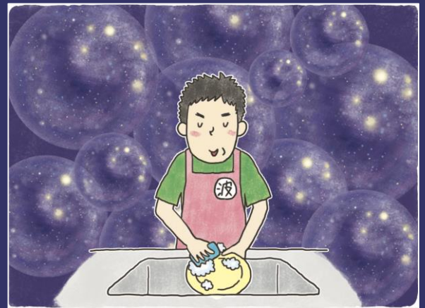
銀河は泡状に分布している