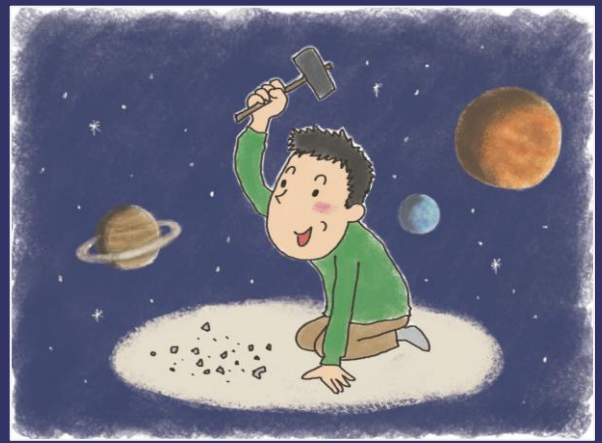
ものをどんどん細かく砕いていくと宇宙がみえてくる!?