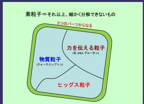
現時点で分かっている素粒子