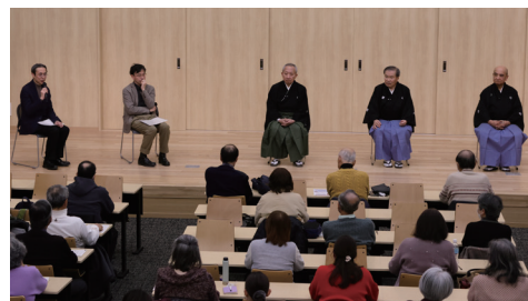
森之宮キャンパス開設記念イベントより