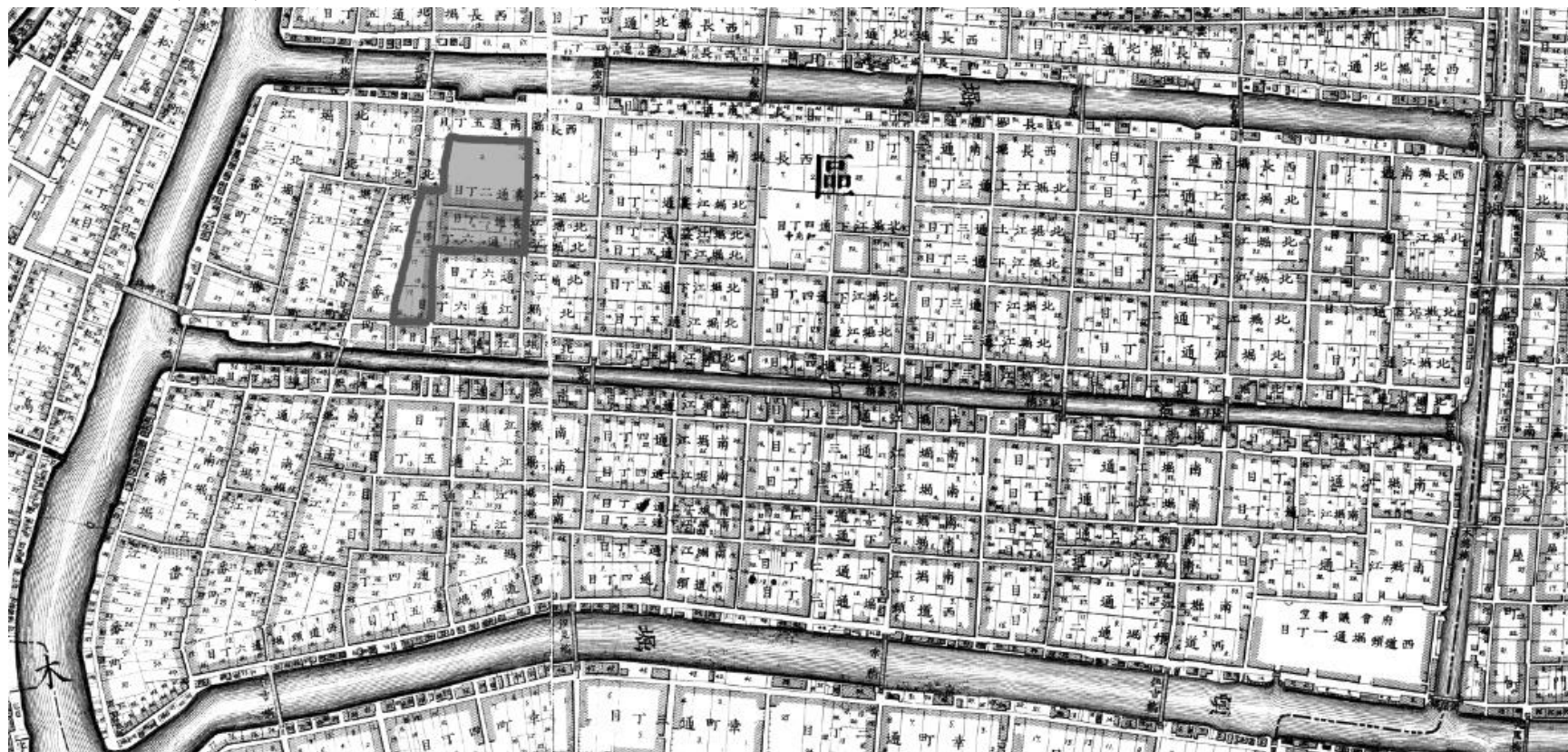
図1 堀江地域の広域図(上が北)