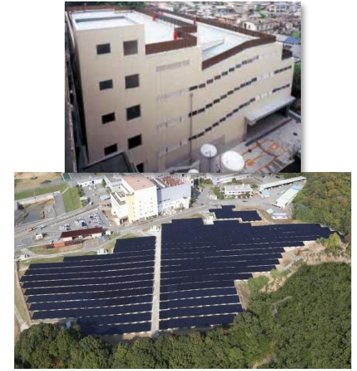
【建築事業・太陽光架台】