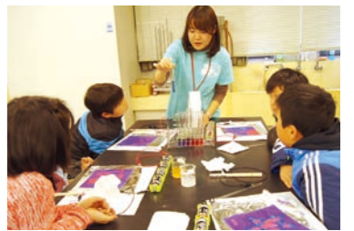
▲IRISサイエンス・キャンパス