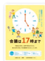
▲「会議は17時まで」ポスター