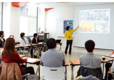
▼ロールモデル・カフェ