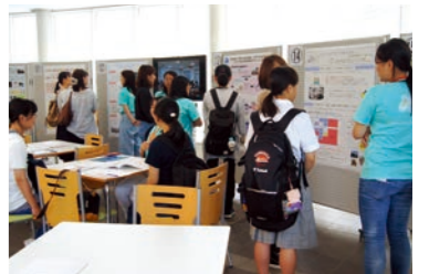
▲めざせ！理系女子コーナー先輩と話そう