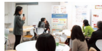
▲女性研究者交流会

地域の女性研究者・技術者と、本学の女性教員が研究やワーク・ライフ・バランスについて情報交換し、ダイバーシティの取組みについて理解を深めるとともに、共同研究など連携推進を図ることを目的として交流会を開催しています。