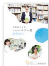
▲ロールモデル集 研究紹介