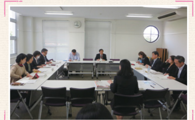
第1回の連携機関連絡会議では、「連携型共同研究助成事業」や今後の取り組み等の実施について協議しました。