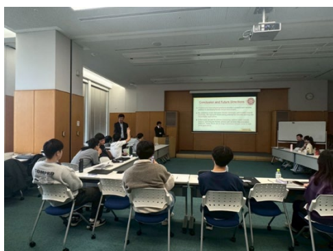
合同グループミーティング