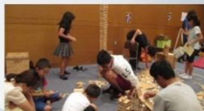
子どものあそびの体験コーナー