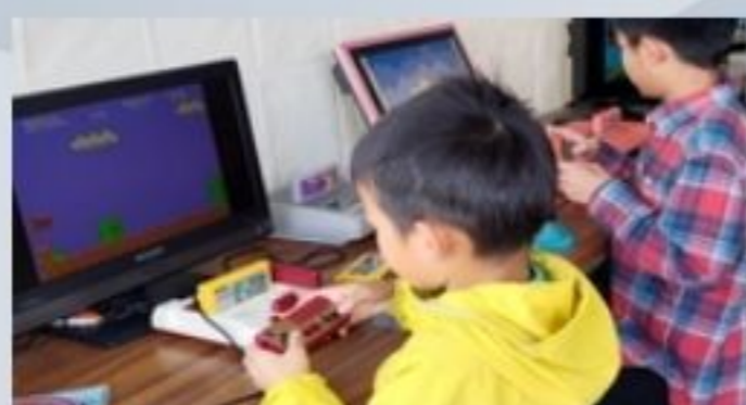
ファミコン・レトロゲーム体験