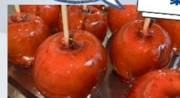
甘くて可愛いスイーツも♪