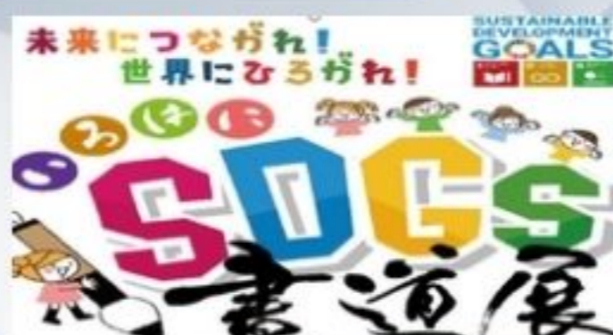
SDGsを書道で表現する作品展