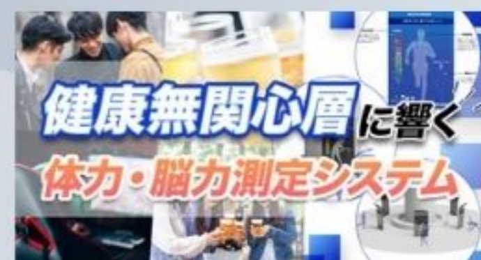
健康無関心層に響く 体力・脳力測定システム WEBカメラ運動・認知機能測定