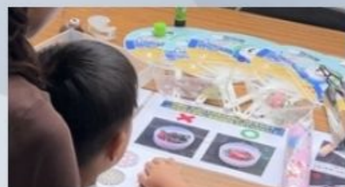
海藻万華鏡体験教室