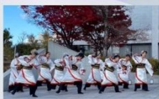
花笑舞 (はなしょうぶ)