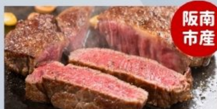
黒毛和牛なにわ黒牛