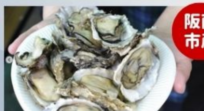
波有手のカキ・下荘オイスター