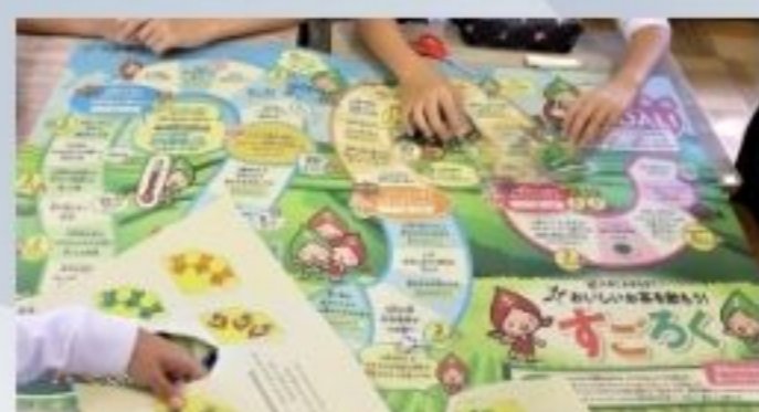
お茶のある暮らし & すころく体験