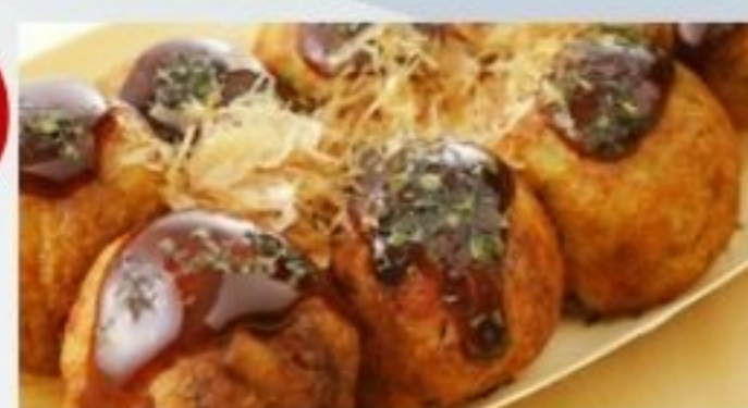
手軽に楽しめるたこ焼き