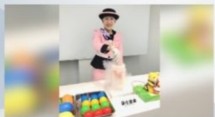
おでかけガス科学館