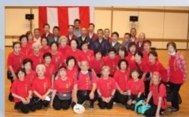
泉州・江州・河内音頭阪南クラブ