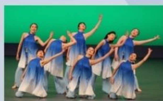
KAE'S JAZZDANCE STUDIO