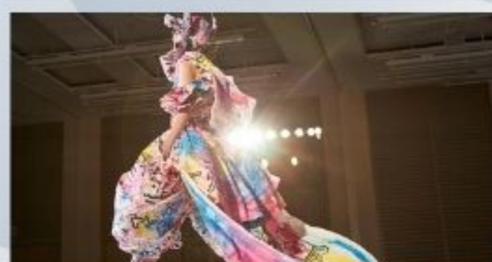
「和紙の布」で制作した服の展示 ※写真はイメージ