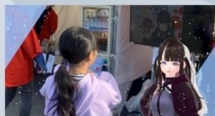
Vtuber体験・アバター作成体験