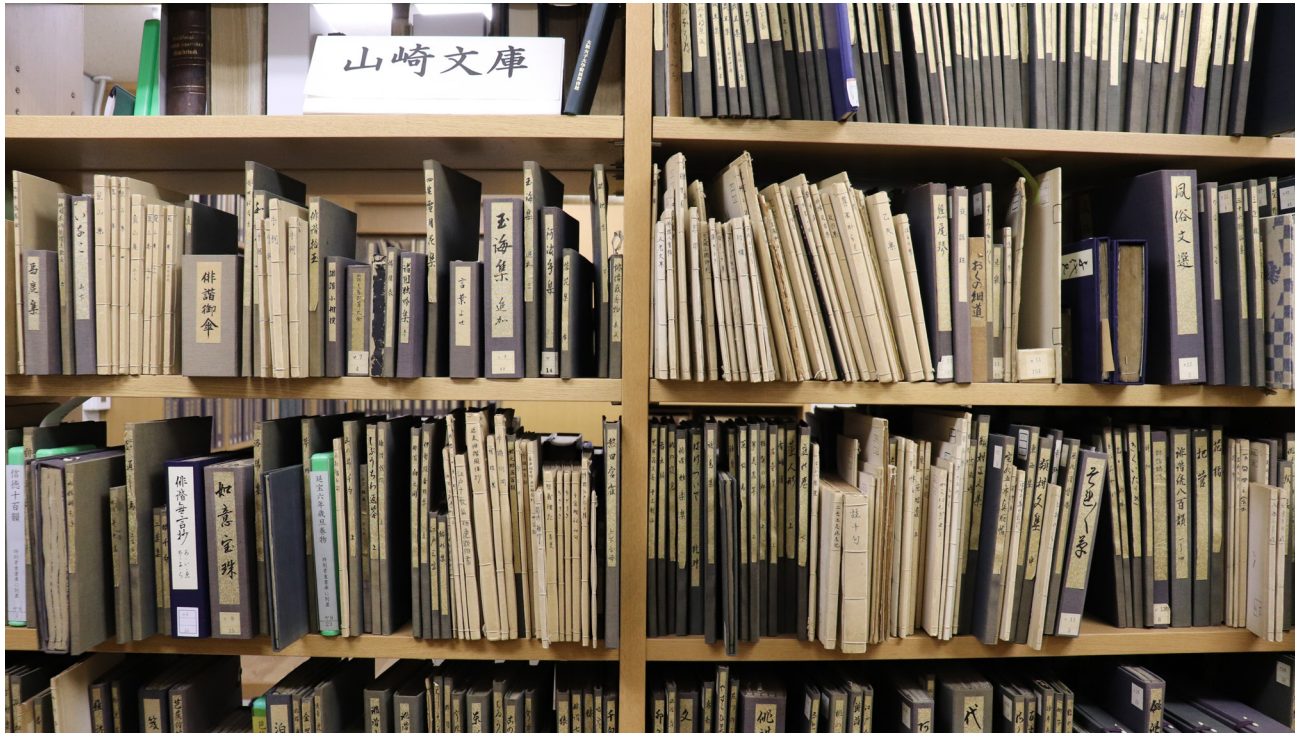
写真1:中百舌鳥図書館の貴重書庫に収蔵されている山崎文庫。白いボール紙の表紙を付けて、和綴じされたものがペン写本である。