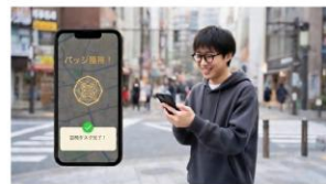
学生おすすめ スポット

特定のピンを訪問すると、NFTバッジを獲得できます。ピンごとに得点が異なるので、戦略を立てながら巡ってみてください！