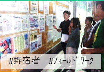
#野宿者 #フィールドワーク