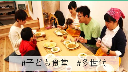
#子ども食堂 #多世代