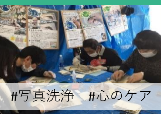
#写真洗浄 #心のケア