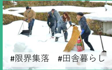
#限界集落 #田舎暮らし