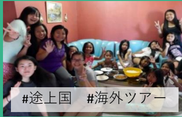
#途上国 #海外ツアー