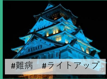
#難病 #ライトアップ