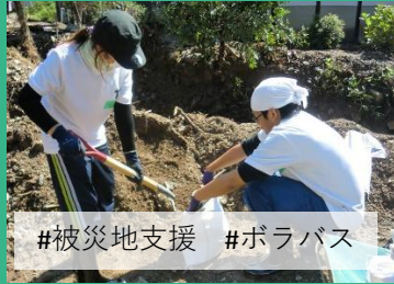
#被災地支援 #ボラバス