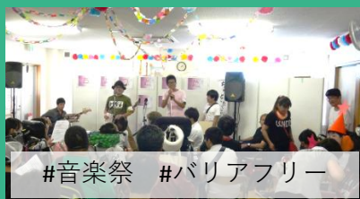
#音楽祭 #バリアフリー