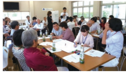
府大近所サミット

大阪府立大学の近隣の住民、活動者と事業者が一堂に集い交流する機会を「府大近所サミット」として2016年10月1日に開催した。大阪府立大学は、堺市の中区、北区、東区の境界に立地しており、このサミットにより普段は区を越えての交流の経験が少ない活動者や組織をつなげると同時に、大学側にとっても近隣に対する社会貢献を進めることになった。自治会関係者、ボランティア、PTA、商店街関係者、社会福祉協議会、福祉施設などから50名の参加があった。内容としては、お披露目を兼ねて本センターの設置主旨を説明した後、グループに分かれて活動状況や地域の課題などを話し合い、全体で共有を行った。担い手の問題、活動拠点の問題、情報の共有化などに関する意見が活発に出された。参加者からは互いのことを知り合う機会になったという評価や大学との関係づくりに対する期待も出された。