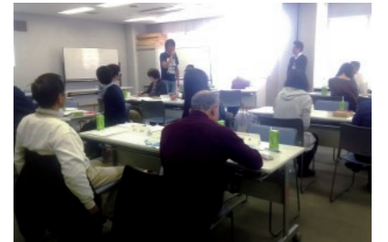
中区さかいボランティア連絡会 交流研修会