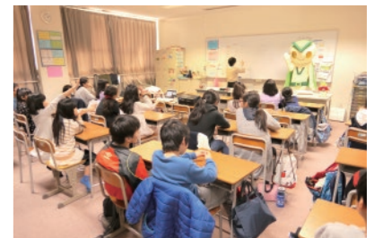
ボランティア先生出前授業

小中学生に対するボランティア啓発の取り組みとして、大学生が講師役(ボランティア先生)となりマスコットキャラクター「V仮面」と共に出前授業を行う事業を新規で実施。白鷺小学校放課後ルームにて2018年3月23日に開催し、約20名の子どもへの参加があった。