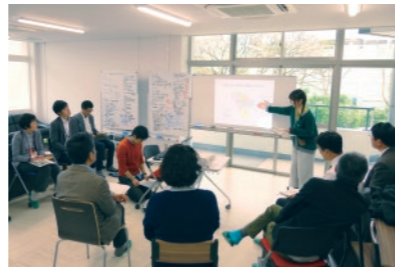
大学の連携に向けた社会貢献セミナー

堺市内に拠点を置く大学の社会貢献部署等に関係する教員・職員・学生を対象とした社会貢献セミナー「若者と地域がつながるまちを目指して～大学の社会貢献プラットフォームづくり～」を2018年3月22日に開催した。10数名の参加があり、本センターや堺市社会福祉協議会による実践報告が行われた。また、本センター学生スタッフにより「若者と地域がつながるまち」プロジェクトが話題提供され、堺市内の若者・学生による社会貢献活動の今後の大学間連携の必要性について話し合いを行った。参加大学からは、学生の自主組織を運営していくことの難しさなどが語られ、今後の学生交流の実現に向け具体的な顔つなぎの場となった。