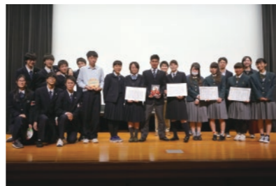
高校生ボランティア・アワード

「堺市中間支援組織情報交換会」での連携がベースとなり、堺市社会福祉協議会、SEIN、そして本センターによる共催で「さかいボランティア・市民活動チャレンジ(※「さかいボランティア・市民活動フェスティバル2017」内プログラム)」を2017年10月28日に実施した。堺市内の高校に通う生徒のボランティア活動等を顕彰する機会として「高校生ボランティア・アワード」を、実践発表・交流会において「学生・ワカモノのボランティア」というテーマで分科会を企画実施。準備段階から大学生が事業推進に関わり高校生と大学生間の交流促進を実現すると共に、若者の社会参加促進に向けた意見交換を行うことができた。