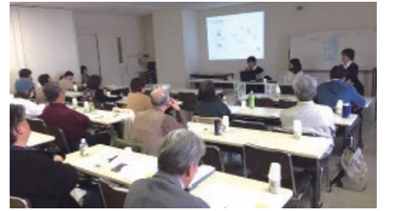
市民協働ひろばステップアップセミナー

2016年4月に起きた熊本地震の際に現地では支援活動を行った社会福祉施設と大学の取組みを中心とするフォーラム「熊本地震の福祉避難所の運営から学ぶ」を2016年11月20日に開催した。参加人数は46人であった。