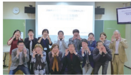
大阪の市民活動の未来に向けて

大阪府下の中間支援組織の連携を強めるために各組織からの参加を得て、会合を実施した。大阪には、社会的な民間活動の伝統があり、ボランティア・市民活動支援についても一定の蓄積がある。ただし、近年さまざまな中間支援組織が生まれてきており、それらが個々に活動するだけでなく連携・協働しながら活動を進めるための場が求められていた。本センターの設立が契機となり、その機会を持つことができた。ラウンドテーブル「大阪の市民活動の未来に向けて」は2017年2月12日に本学を会場に、15名の参加を得て行われた。参加組織は、本センター、堺市社会福祉協議会、SEINの堺市内3組織のほか、大阪ボランティア協会、大阪NPOセンター、大阪府社会福祉協議会、大阪市社会福祉協議会である。セミオープン形式で実施し、各担当ばかりでなく関心がある者も傍聴できるようにした。各組織の状況や課題の共有化を行い、今後どのような活動や連携を目指していくかについて意見交換した。これからもこうした話し合いの場を持っていくことを確認した。